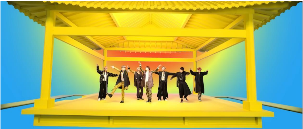
Figura 3 – BTS em trajes tradicionais coreanos no videoclipe “IDOL” (2018)

Essa combinação estética e sonora cria uma linguagem que simultaneamente celebra a identidade nacional coreana e dialoga com o imaginário cosmopolita da cultura pop global. O resultado é uma obra visualmente exuberante e simbolicamente potente, na qual a tradição não é apresentada como passado estático, mas como matéria viva que se reinscreve na modernidade.