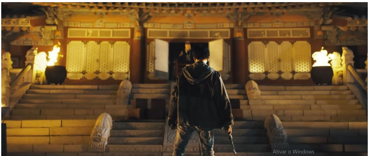
Figura 6 – Cena do confronto entre o “rei” e o “rebelde” em “ Daechwita ” (2020)

Ao alternar cenas do rei e do rebelde, o clipe dramatiza a ruptura da hierarquia simbólica: o artista desafia as estruturas de poder (tanto as políticas quanto as coloniais) e, ao final, o rebelde executa o rei (Figura 6), sinalizando a substituição de uma modernidade dominadora por uma modernidade insurgente e plural.