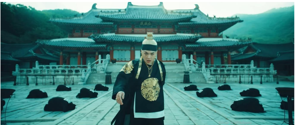
Figura 5 – Agust D como rei da era Joseon em “Daechwita” (2020)

No videoclipe, Agust D articula essa sonoridade ancestral com batidas de hip-hop moderno, flows agressivos e visuais cinematográficos, criando um espaço de enunciação que tensiona tradição e modernidade, passado e presente, Oriente e Ocidente. O palácio histórico coreano ( Yongin Daejanggeum Park ) onde o MV se ambienta é reconfigurado como cenário de conflito entre duas versões do próprio artista, um rei despótico e um revolucionário de rua, ambos interpretados por SUGA. Essa duplicidade dramatiza o embate entre poder e resistência, status e autenticidade, que são temas centrais à modernidade tardia e à crítica pós-colonial.